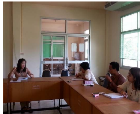
องค์การบริหารส่วนตำบลบ่อสวก วันที่ ๑๑ พฤษภาคม ๒๕๕๘