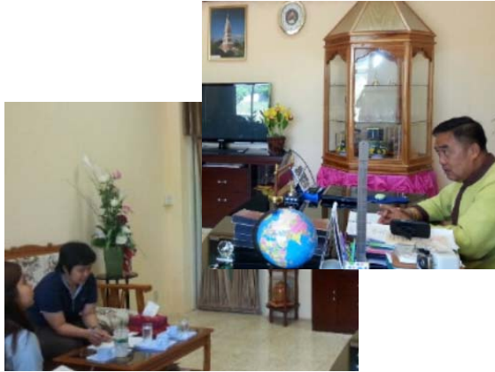
เทศบาลตำบลนาอ้อ วันที่ ๑๔ พฤษภาคม ๒๕๕๘