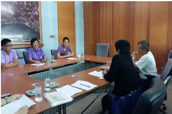
เทศบาลตำบลบางละมุง วันที่ ๒๗ เมษายน ๒๕๕๘