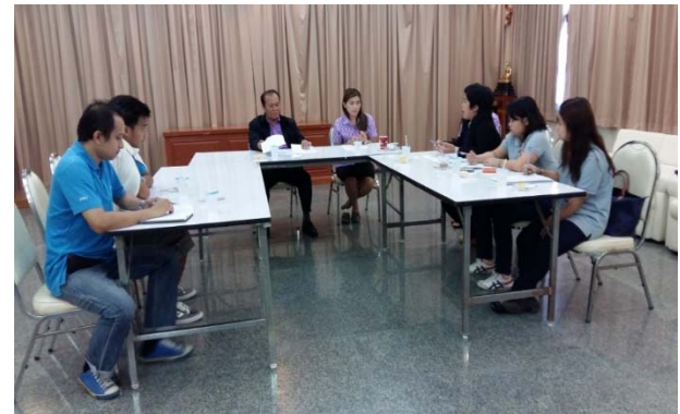
เทศบาลตำบลห้วยใหญ่ วันที่ ๒๘ เมษายน ๒๕๕๘