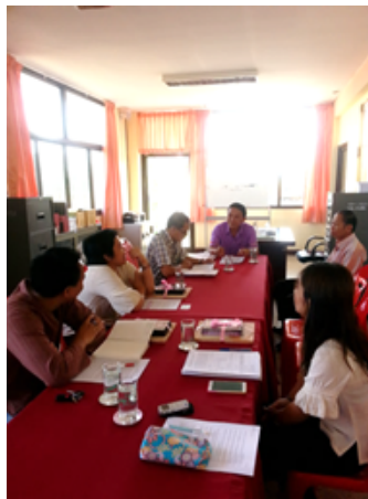
องค์การบริหารส่วนตำบลม่วงตึ๊ด วันที่ ๑๑ พฤษภาคม ๒๕๕๘