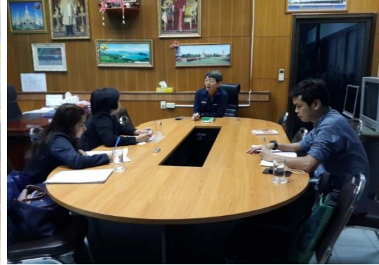
วันที่ ๒๓ เมษายน ๒๕๕๘ เทศบาลตำบลอู่ทอง