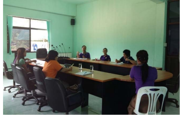
องค์การบริหารส่วนตำบลปลาบ่า วันที่ ๑๔ พฤษภาคม ๒๕๕๘