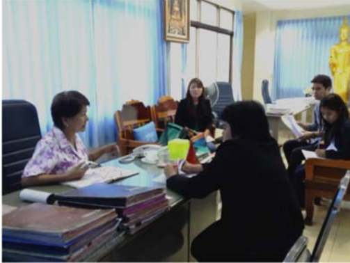
วันที่ ๒๓ เมษายน ๒๕๕๘ เทศบาลตำบลท้าวอู่ทอง