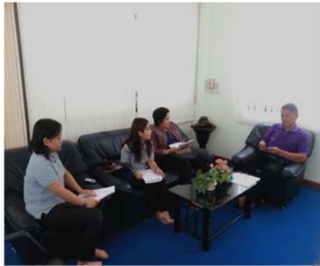
องค์การบริหารส่วนตำบลแหลมกลัด วันที่ ๗ พฤษภาคม ๒๕๕๘