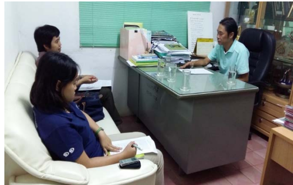
องค์การบริหารส่วนตำบลเกาะช้างใต้ วันที่ ๘ พฤษภาคม ๒๕๕๘